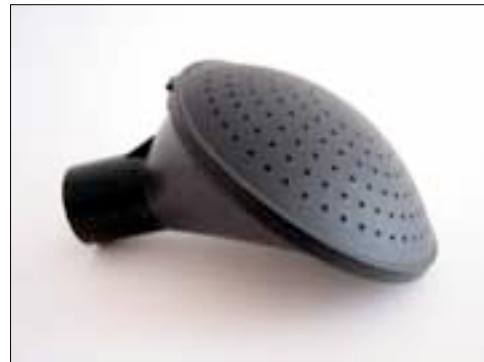
Brauskopf, ist Bestandteil der Giesskanne