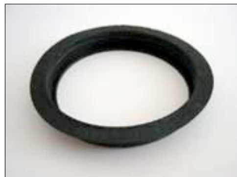
HT - Doppeldichtung