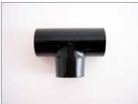
T-Stueck, Art Nr. 5130 Kupfer schwarz lackiert