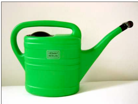
Giesskanne, 10l, Art Nr. 5010

Label aussuchen, ausschneiden und aufkleben.